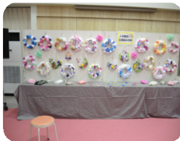
JA女性部広瀬館支部の作品