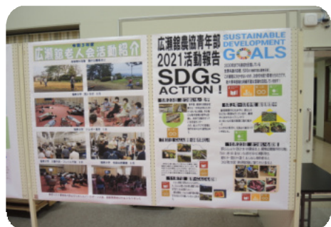
各種団体活動報告