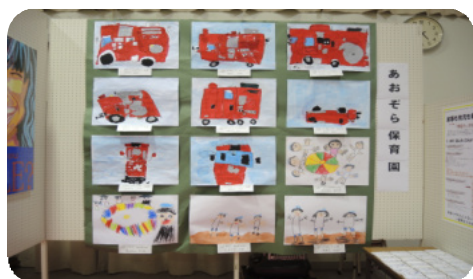
あおぞら保育園児の作品

27日（土）まで開催していますので、ご来場お待ちしております。開催にあたり諸準備をしていただいた団体、協議会委員の皆さま、ご支援誠にありがとうございました。