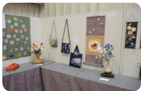
セルタスの皆さんの作品