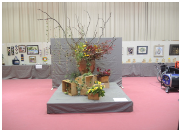
正面には《草月流生花》でお迎え

11月21日（日）から11月27日（土）までの1週間、広瀬館交流センターでふれあい祭作品展が開催中です。昨年は、1月の開催でしたが、今年は、作品展だけ秋に開催してはということで11月の開催になりました。