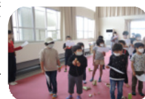
アカペラでも練習

5月21日(土)9時から生涯学習部会で火の用心の歌の練習をしました。指導は、コーラスグループ青い鳥の皆さん(8名)にお願いしました。近年コロナ禍もあり、火の用心まわりが出来ない状態で、低学年の子供達に歌を歌えるようになってもらいたいと思い企画しました。最初は青い鳥の皆さんに歌ってもらい、すぐには歌えませんでした。子供達(28名)はCDでの伴奏を聞きながら、次第に大きな声で歌うことができるようになりさすがに吸収が早いと感心しました。父兄の方も当時を思い出しながら、歌っておられました。6月から、2年ぶりに火の用心まわりが始まります。まだ、コロナ禍ということで全員での活動は控え、2班のグループに分かれて活動します。活動日は6月から11月の第2・第4土曜日の午前8時から30分です。地域の皆さんも久しぶりの火の用心まわりを楽しみにしてください。