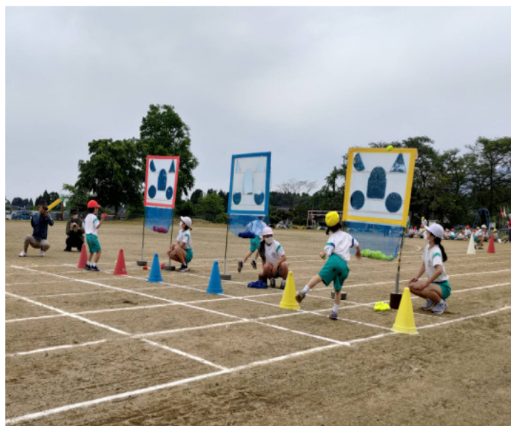
「入れ！」 全員参加の「夏祭り大作戦」

5月15日(日)福光南部小学校運動会が開催され、「かがやけ南部っ子！！～心を一つに目指せ優勝～」を合言葉に、それぞれの団が、勝利に向かって、児童らが心を一つにして取り組みました。14日に予定されていましたが、雨天のため延期されたもの。