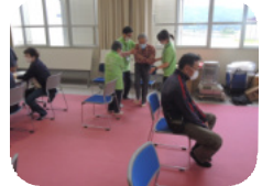
健康チェックの様子

フレイルチェックを終えた後、どこが元気で、どこが元気でないかをみんなで認識することが出来たような気がしました。そして、社会とのつながりを失うことがフレイルの最初の入り口になるということわかってきました。皆さんも自分に合った、活動を見つけ、楽しくいきいきとした毎を送りましょう。まずは、「みんなのサロン」に参加してみませんか。