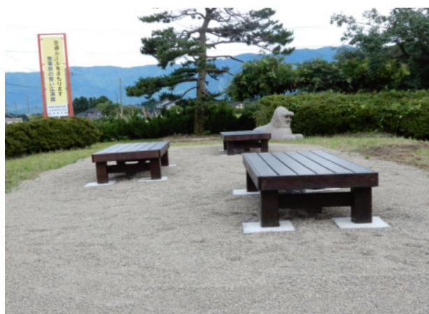
これで安心。座り心地は満点。

農村公園のベンチが木のベンチに様変わりしました。今までのベンチは、コンクリートのベンチでしたが、年月とともに破損し、鉄筋がむき出しになり、とても危険なベンチでした。農村公園には、あおぞら保育園の園児の園外保育や南部小学校の児童らの利用もあるため、協議会理事会で協議の結果、撤去し、新しくすることに決めました。新しいベンチは、手作りの木のベンチで、これまでより幅が広くなり、座り心地も良くなりました。