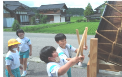
南部っ子館社中も一緒に！！