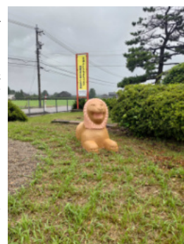
ライオンさん再登場

農村公園のベンチが木のベンチに様変わりしました。今までのベンチは、コンクリートのベンチでしたが、年月とともに破損し、鉄筋がむき出しになり、とても危険なベンチでした。農村公園には、あおぞら保育園の園児の園外保育や南部小学校の児童らの利用もあるため、協議会理事会で協議の結果、撤去し、新しくすることに決めました。新しいベンチは、手作りの木のベンチで、これまでより幅が広くなり、座り心地も良くなりました。