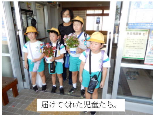
届けてくれた児童たち。

9月5日(月)南部小学校の児童が、夏休み中に家で大切に育てた「人権の花」ペゴニアを広瀬館交流センターに届けてくれました。人権の花運動とは、昭和57年度から実施されて、小学生を対象とした啓発運動です。内容は、学校に配布した花の種子、球根などを、子どもたちが協力し育てることで生命の尊さを実感し豊かな心を育み、優しさと思いやりの心を持ってもらう事を目的としたものです。児童たちは、ペゴニアを育てることで、思いやりの心、命の大切さを感じることが出来たようです。これからは、交流センターで大切に育てたいと思います。