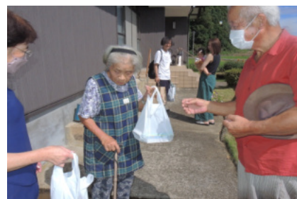
お孫さん夫婦もお祝いに・・・