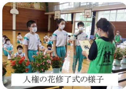
人権の花修了式の様子