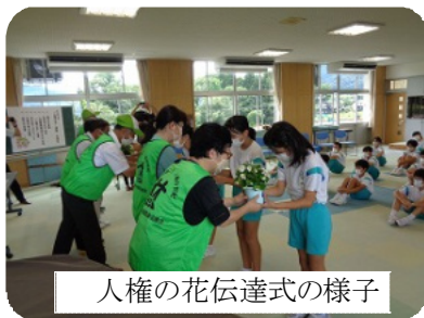
人権の花伝達式の様子