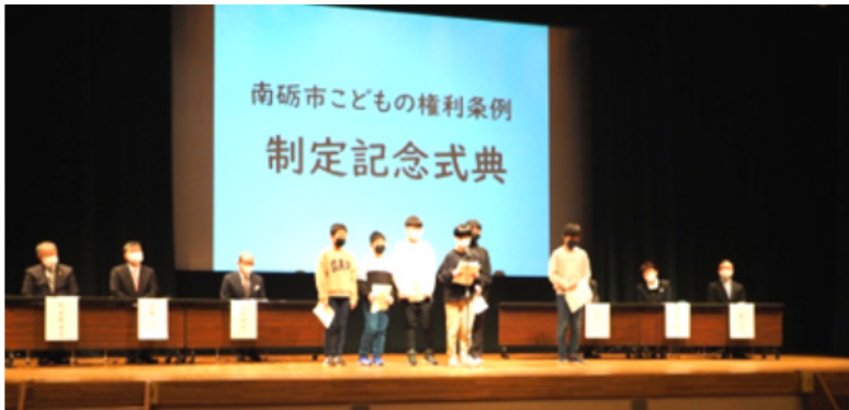
メッセージを発表する子どもたち

2月11日(日)、井波総合文化センターで「南砺市こどもの権利条例制定記念式典」が行われました。この式典は、この条例が制定され今年4月1日に施行されるのを記念するとともに、市民に条例についての理解を深めるために行われたもの。