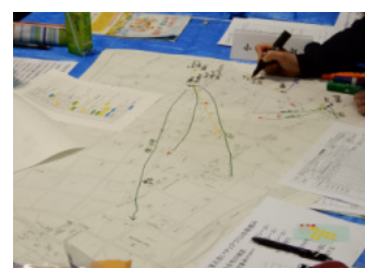
マップづくりの様子