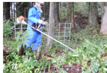
祖谷担当場所の作業模様

広瀬館地域づくり協議会は、10月1日(日)、3地区合わせて34名が参加して、里山再生事業に取り組みました。これは、熊の出没が予想される山際に緩衝帯を作るため毎年行っているもの。