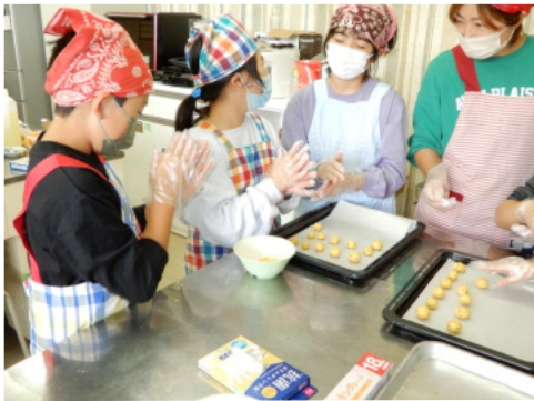
どんな形にしようかな

10月15日(日)9:30から、異世代交流事業で、焼き芋大会とおやつ作りを開催しました。当初さつまいも掘りも予定していましたが、熊が出没していることや天候も考慮して、芋掘りは大人だけで掘ってもらいました。交流センターに集まった子ども達は、焼き芋が焼ける時間まで、おやつ作り(サツマイモクッキー)をしました。高学年の子ども達にはサツマイモの皮むきから包丁で切ったりの作業を