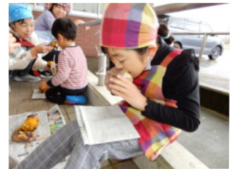
「焼き芋 おいしーい!」

してもらい、他の学年の子ども達には、クッキーの生地を混ぜたり、クッキーの形づくりをしてもらいました。集会場では、新聞紙で焼き芋を入れる袋を作ったりと、参加していた子ども達と父兄で美味しいサツマイモクッキーが出来上がりました。当日は朝からJA青年部、成人クラブ、生涯学習部員の皆様のご協力していただきありがとうございました。