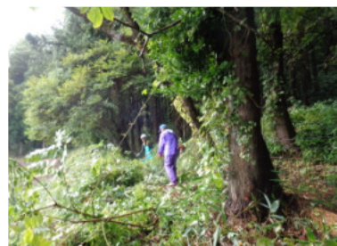
小坂担当場所の作業模様

皆さんの努力により明るくなり、熊が隠れる場所が無くなりました。ありがとうございました。