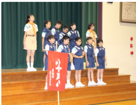
6年生の火災予防研究発表