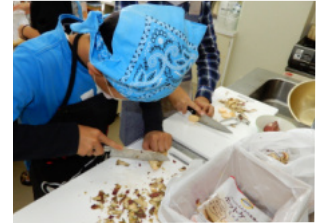
包丁さばきが上手!

10月15日(日)9:30から、異世代交流事業で、焼き芋大会とおやつ作りを開催しました。当初さつまいも掘りも予定していましたが、熊が出没していることや天候も考慮して、芋掘りは大人だけで掘ってもらいました。交流センターに集まった子ども達は、焼き芋が焼ける時間まで、おやつ作り(サツマイモクッキー)をしました。高学年の子ども達にはサツマイモの皮むきから包丁で切ったりの作業を