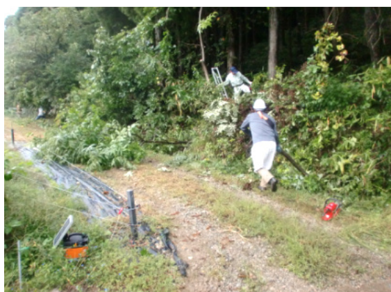
「明るくなった」 館担当場所の作業模様

広瀬館地域づくり協議会は、10月1日(日)、3地区合わせて34名が参加して、里山再生事業に取り組みました。これは、熊の出没が予想される山際に緩衝帯を作るため毎年行っているもの。