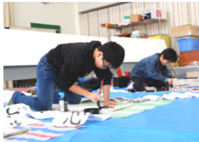
真剣に取り組んでいます！