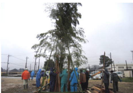
みぞれ交じりの中で準備

世話をしていただいた皆さん、そして左義長の火が消えるまで寒い中、最後まで見守っていただいた消防団の皆さん、本当にありがとうございました。