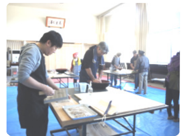
真剣にそば打ちをする団員

令和5年12月30日(土)交流センターで、広瀬館分団の団員(6名)が蕎麦打ちに挑戦しました。当日は蕎麦打ち愛好会の有志(5名)から、蕎麦打ちのコツを丁寧に教えてもらいました。蕎麦は、蕎麦粉、つなぎ、水の分量が大事で、一度に大量の蕎麦打ちをするときは、最初の水加減が難しいとのこと。参加した団員は、慣れない手で、生地を伸ばしていました。最後の駒板を使った難しい蕎麦切りは、細くきれいな蕎麦や、うどんのような太い蕎麦になりましたが、楽しい蕎麦打ち会でした。出来上がった蕎麦は、年末消防警戒の後、分団員のみなさんに振る舞われました。