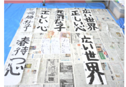
参加した児童の書初め