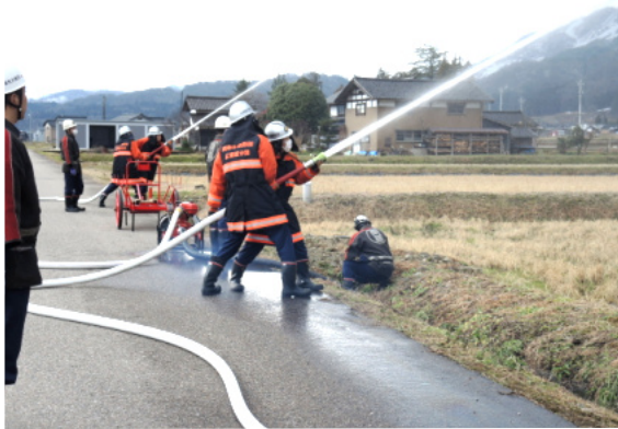
力強く初放水をする広瀬館団員

令和6年1月6日(土)、福野文化創造センターヘリオスで「令和6年南砺市消防出初式」が開催されました。南砺市消防団各方面団、なんとレディー分団など関係者約800人、車両14台が参加し、初放水や分列行進などが行われました。