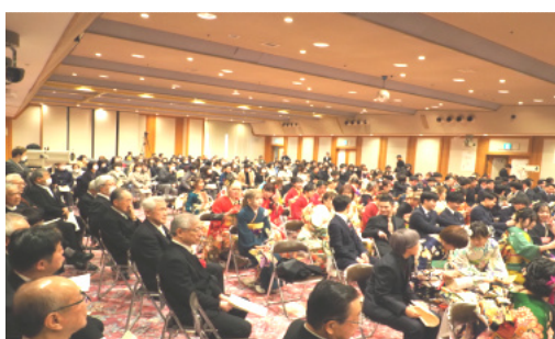
今年度は父兄の方も会場に参加