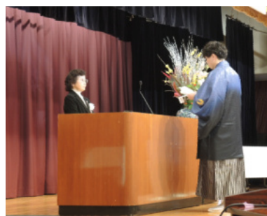
恩師の前で謝辞を述べる代表者