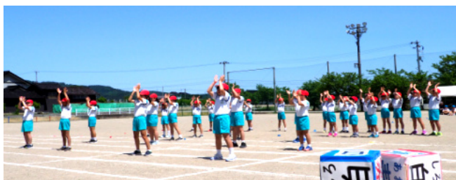
力強く「さんさん ななびょうし!!」