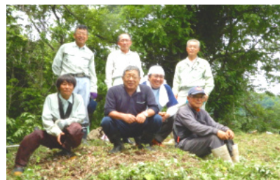
作業を終え山頂で一服

現在この道は不明瞭な所が多く、険しくて山頂まで行きつくのはなかなか厳しいため、訪れる人も少ないのですが、今回一部歩きやすい新たなルートを作り、一番厳しい山頂付近に鎖を取り付けて登りやすくしました。(鎖