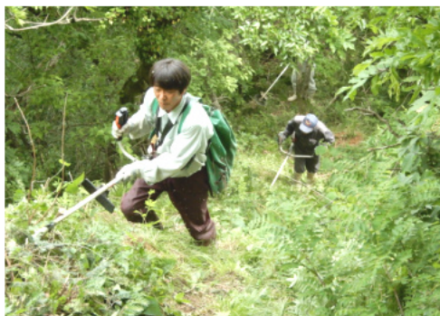
険しい山道の草刈りに奮闘

5月19日(日)午前9時から、参加者8名が城山(別称・広瀬城跡)登山道整備に汗を流しました。当日は天候に恵まれ、基幹林道の広瀬城跡の看板がある登山道入口から、山道の草刈り、倒木の処理、荒れた道の補修を行いながら、標高350メートルの山頂を目指し、参加者は草刈り機や長鎌で、登山道整備に汗を流しました。