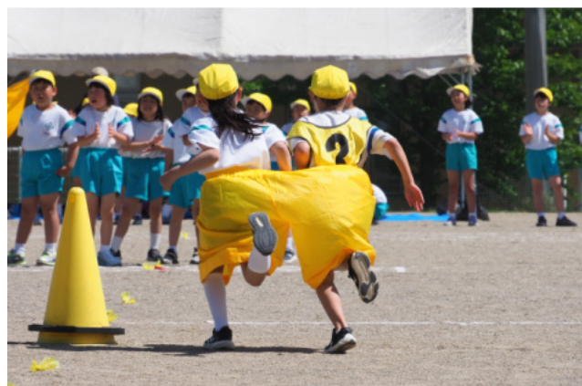
それいけ!でカバンマン「うまく回れたね」