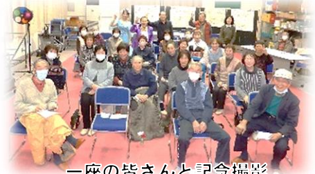
一座の皆さんと記念撮影

また歌と踊りのアンコールや、会場の中の参加者と歌手が一緒に「二輪草」を歌われると、会場からは拍手喝采があがり大いに盛り上がりました。最後に一座の皆さんと記念の写真を撮り楽しい集いを終了しました。