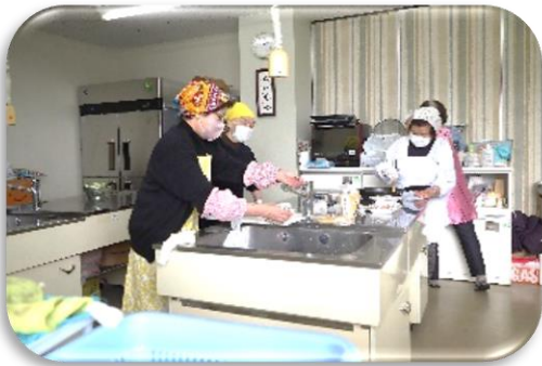
館女性スタッフのみなさん

センターに戻り、館地区女性スタッフの皆さんによる昼食を兼ねた手作りおにぎりや豚汁が振る舞われ、おかわりする人もあり、美味しくいただきました。