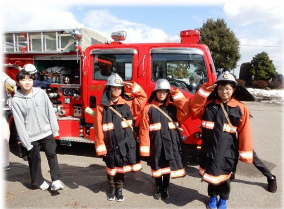
消防ポンプ車乗車体験

3月20日(木)、広瀬館地区自主防災会会員、消防団員、小学生児童など約50名が参加して、「広瀬館地区防災訓練」を実施しました。