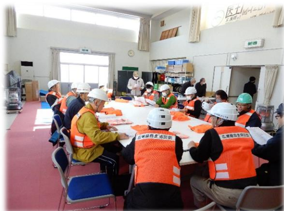
災害対策本部開設訓練