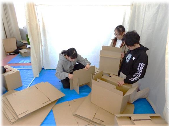
小学生児童による避難所設営訓練